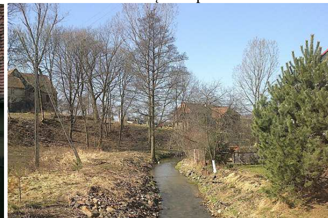
rzeka Czerwona Woda