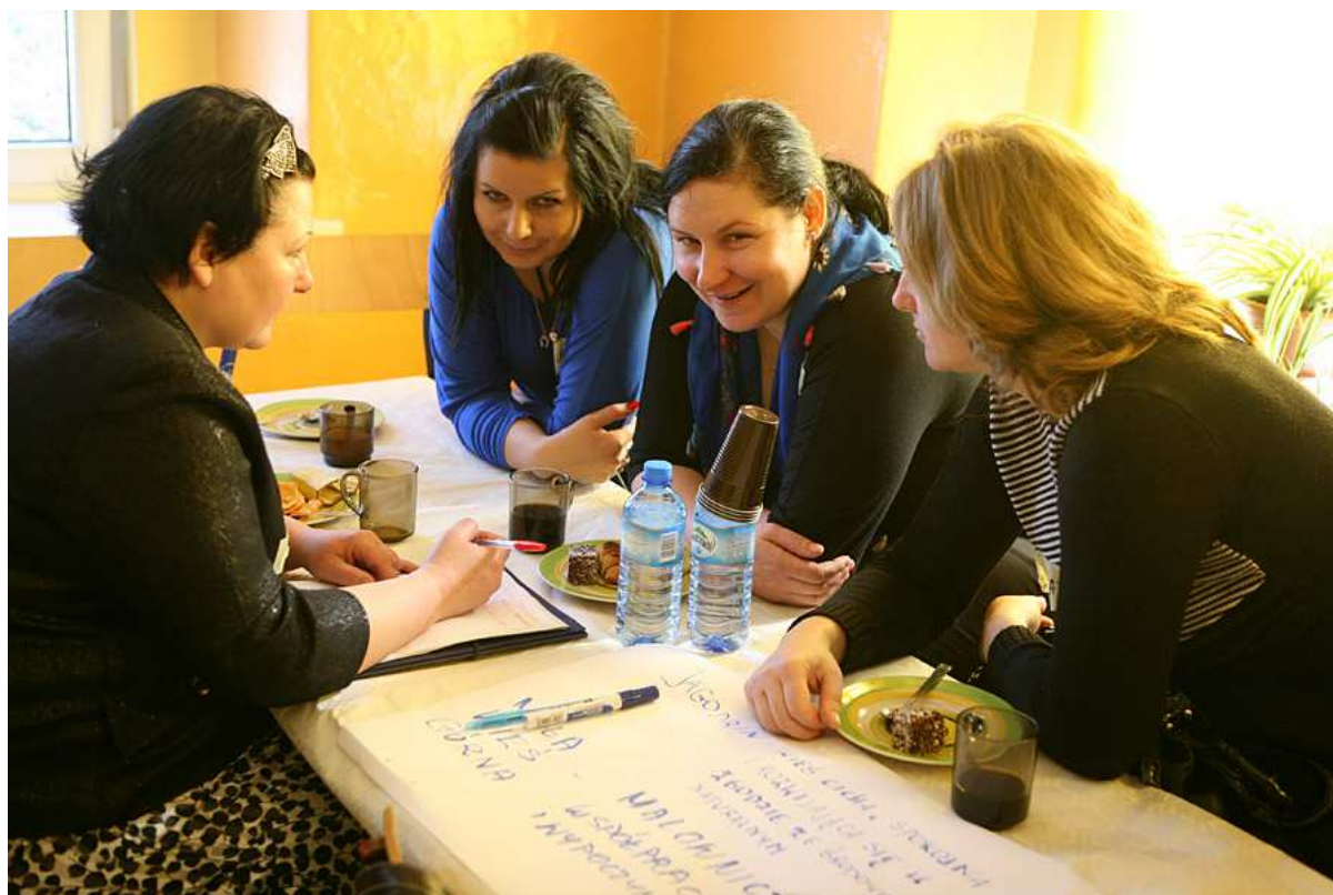
Praca nad strategią

Mała Wieś Górna to malownicza i zadbana wieś, w której mieszkańcy współpracują i wzajemnie sobie pomagają. Posiadamy dobrej jakości infrastrukturę techniczną, a baza rekreacyjno - kulturalna jest chętnie wykorzystywana przez wszystkich mieszkańców. Jesteśmy społeczeństwem łączącym pokolenia i kultywującym tradycje i obyczaje lokalne. Żyje nam się dostatnio i wieś jest znana w regionie.