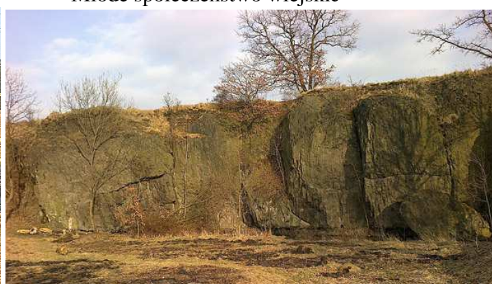
„Debra” – przestrzeń publiczna