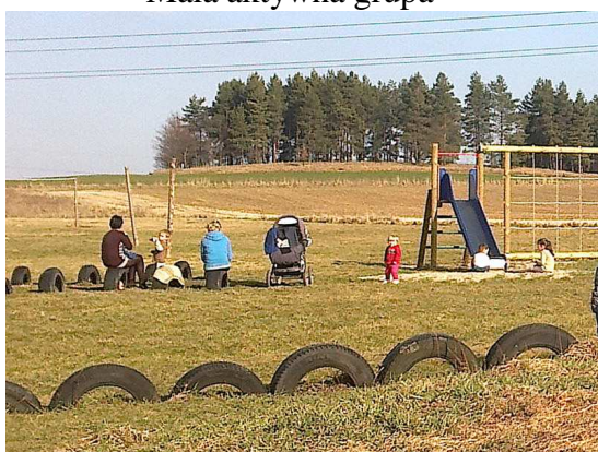
Plac zabaw dla dzieci