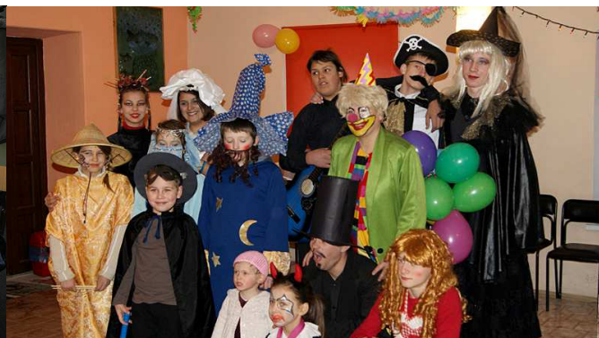
Młode społeczeństwo wiejskie