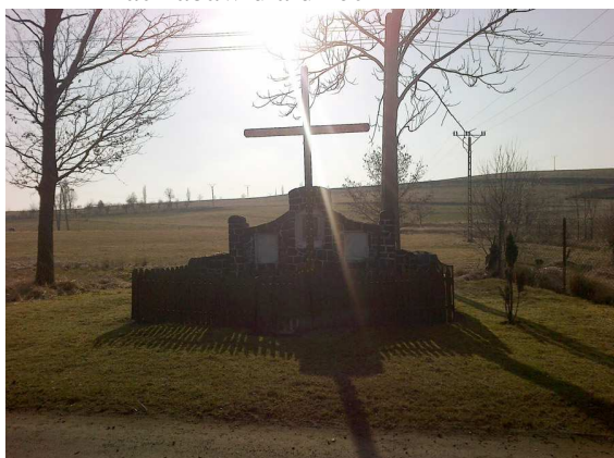
Kapliczka z krzyżem