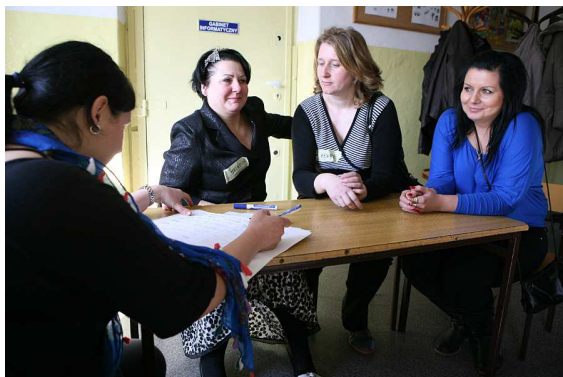
Mała aktywna grupa